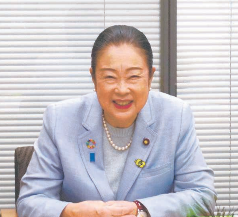
土屋 品子 (つちや・しなこ) 昭和27年2月9日生まれ。平成8年10月の第41回衆議院議員総選挙で初当選。衆議院外務委員長、消費者問題に関する特別委員長、外務大臣政務官、環境副大臣、厚生労働副大臣、復興大臣などを歴任。現在は自民党国際局長代理。 (※略歴は土屋議員公式ホームページのプロフィール、衆議院ホームページの議員情報を基に作成)