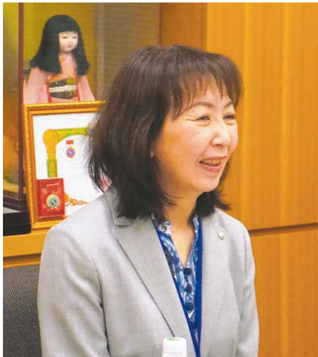
滋谷後援会幹事長

新人議員だった私がすんなりと協力依頼を受けたのは、議員になる前に移植が必要なお子どもを支援するため、駅前街頭募金活動をした経験があったから