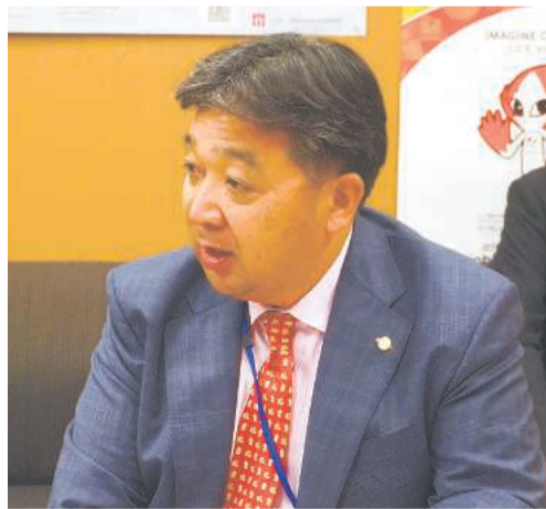
山本後援会対策副委員長